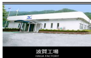
波賀工場 HAGA FACTORY