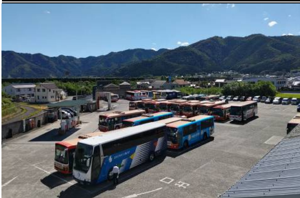
宍粟市 山崎営業所