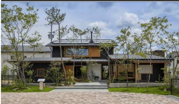
しろう杉の家 龍野モデルハウス