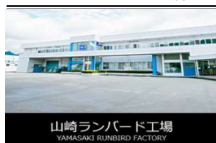
山崎ランバード工場 YAMASAKI RUNBIRD FACTORY